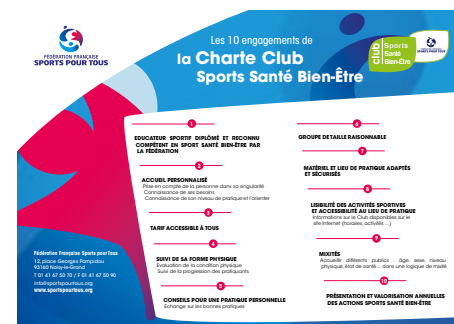
Les critères de la Charte